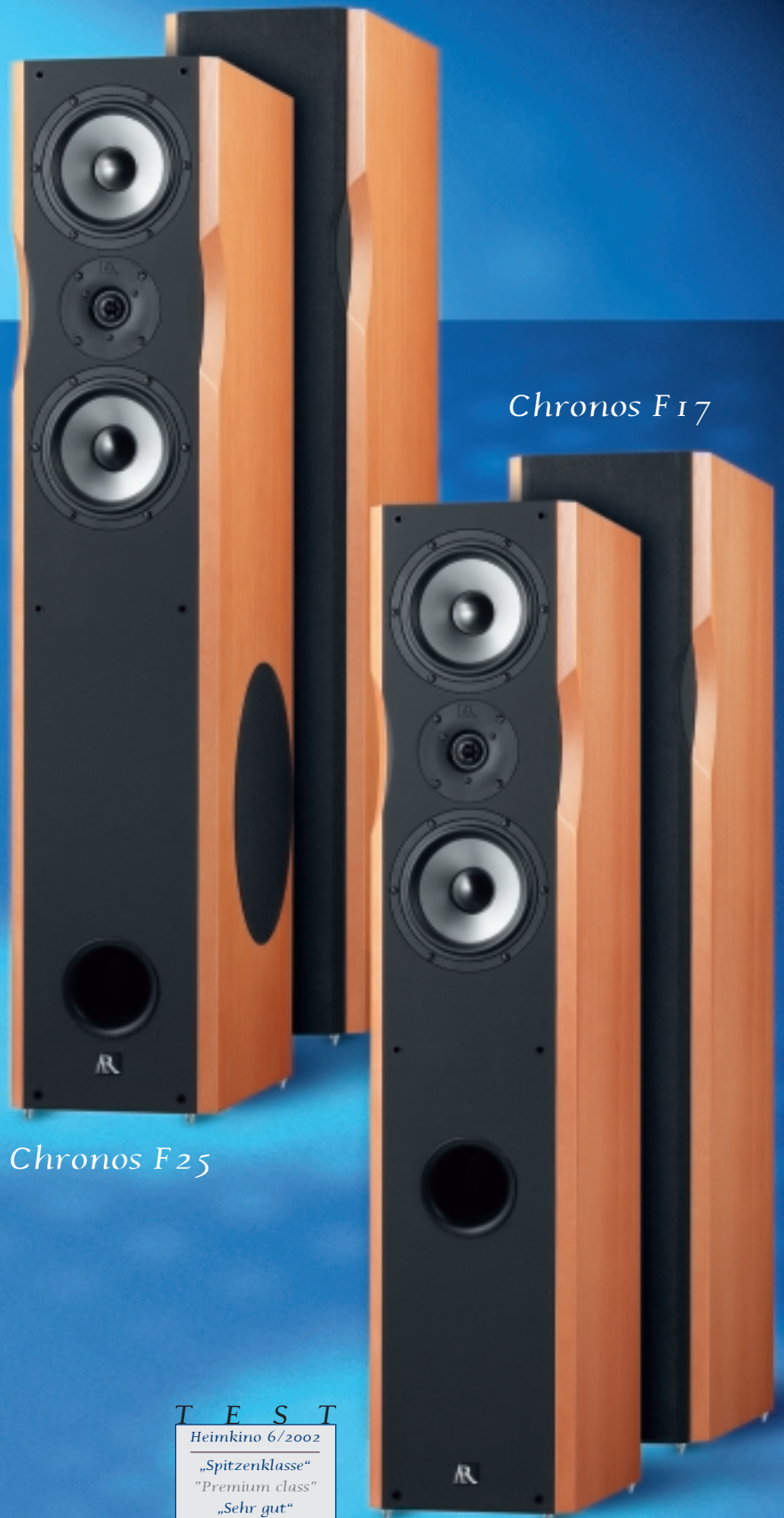
Chronos F 25